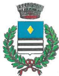
COMUNE DI ISOLA DOVARESE